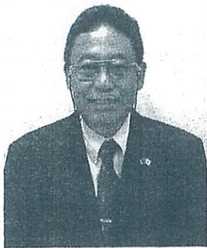
元大統領特別補佐官のイェン氏が新スタッフに